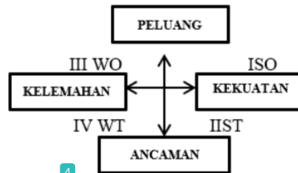
Gambar 1. Diagram SWOT

Tahapan dalam perumusan strategi pengembangan usaha ubi kayu setelah dilakukan analisis matriks EFAS dan IFAS adalah memetakan hasil analisis ke dalam kuadran SWOT yang dapat dilihat pada gambar.