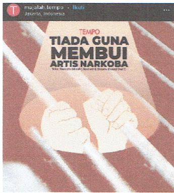
Gambar 6. Akun; @majalah.tempo

Diseminasi simbolik meme penyalahgunaan narkoba dalam media sosial Instagram, tidak sedikit ditampilkan melalui tema-tema hukum dan penghukuman. Simbol meme tersebut digunakan oleh pengguna media sosial Instagram dalam mengekspresikan pandangannya mengenai berfungsi atau tidak berfungsi nya sistem hukum di Indonesia. Hal tersebut juga ditegaskan oleh Harianto et al., (2019) yang mengatakan bahwa sistem hukum dan penghukuman terhadap narapidana tindak pidana narkoba di Indonesia tidak sedikit menjadi sorotan dari berbagai lapisan masyarakat, khususnya dalam rangka membentuk warga binaan agar tidak kembali lagi terjerumus sebagai pecandu narkoba. Oleh karena itu, diseminasi simbolik meme dari penyalahgunaan narkoba dalam media sosial Instagram tidak jarang mendeskripsikan konsep hukum dan penghukuman sebagai tema dalam mendiseminasikan penyalahgunaan narkoba di Indonesia.