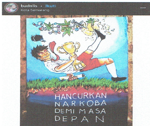
Gambar 3. Akun; @budnlis

diseminasikan melalui simbol meme “Sosok seorang anak laki-laki berbaju putih dan celana merah memakai kaos kaki dan sepatu hitam, sambil memegang piala dan kertas, dengan wajah babak belur dan hampir terjatuh tertimpa daun-daunan, obat-obatan, dan suntikan injeksi, serta terdapat tulisan berupa Hancurkan Narkoba Demi Masa Depan”