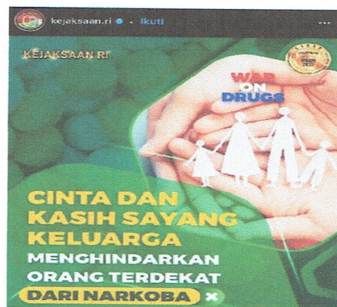
Gambar 7. Akun; @kejaksaan.ri

media sosial Instagram, juga tidak sedikit diseminasikan melalui simbol meme dengan tema lingkungan sosial. Deskripsi dari simbolisasi meme tersebut tidak sedikit muncul dalam bentuk relasi kekerabatan, seperti yang dapat dilihat melalui tampilan simbol meme Gambar (7) yang diunggah oleh pengguna media sosial Instagram bernama @kejaksaan.ri, dimana deskripsi dari simbol meme penyalahgunaan narkoba di Indonesia dapat dilihat melalui tampilan meme “Tangan manusia yang saling menggenggam dan memegang satu sama lain, dan terdapat gambar seperti anak-anak yang memegang tangan ayah dan ibu nya, serta terdapat tulisan berupa War On Drugs, Cinta Dan Kasih Sayang Keluarga Menghadirkan Orang Terdekat Dari Narkoba”. Sejalan dengan deskripsi simbol meme tersebut, Bunsaman & Krisnani, (2020) juga mengatakan bahwa penyalahgunaan narkoba di Indonesia sampai saat ini tidak jarang dipengaruhi oleh relasi lingkungan sosialnya, seperti hubungan orang tua dan anak yang tidak harmonis.