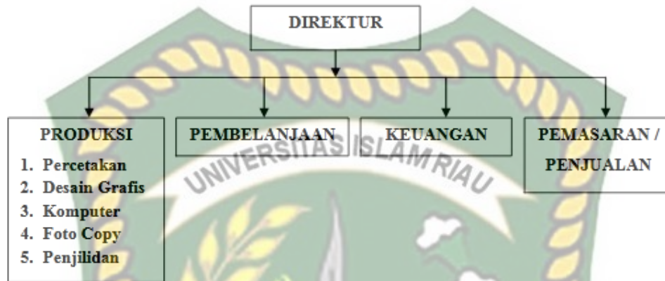
Gambar 4.1. Struktur Organisasi