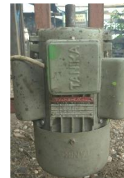
Gambar 2 Motor penggerak