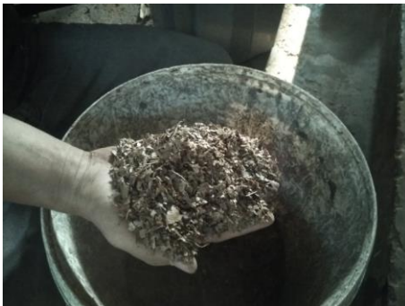
Gambar 5 Daun yang telah dicacah