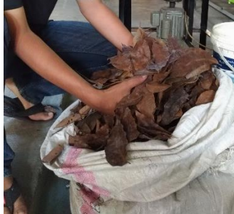
Gambar 4 Daun sebelum dicacah