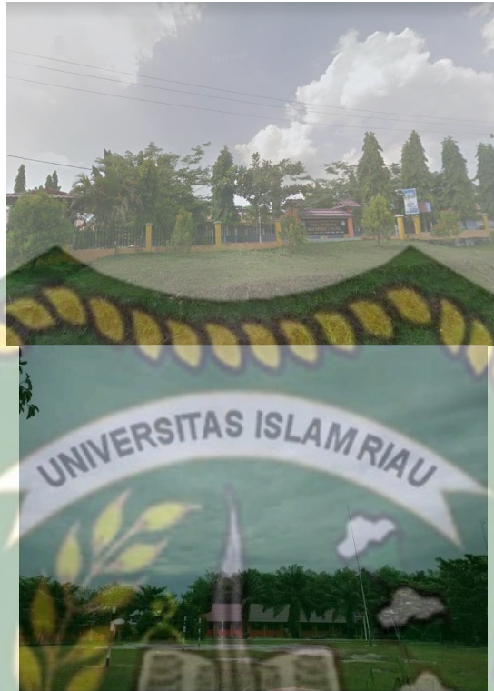
Gambar 5.3 SMA N 1 Kecamatan Pujud SMA N 2 Kecamatan Pujud