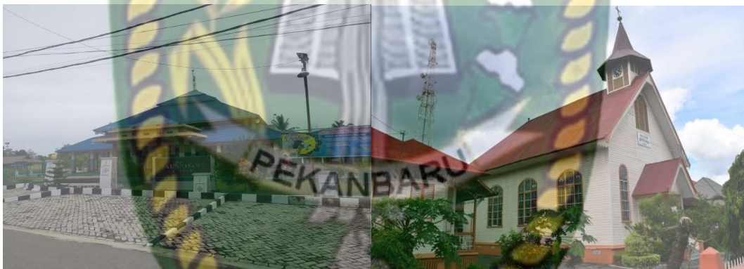
Gambar 5.7 Masjid Al – Istiqomah dan Huria Kristen Batak Protestan (HKBP)

Bangsawan terdiri dari 8 Mesjid, 4 Mushollah, dan 1 Gereja, Untuk desa Suka Jadi 5 Mesjid, 7 Mushollah, 1 Gereja, untuk desa Pujud Utara terdiri dari 2 Mesjid, 1 Musollah, dan 1 Gereja, Untuk desa Perkebunan SiArang Arang 3 Mesjid, 2 Musholah, dan 3 Gereja, Untuk desa Babusalam Rokan 3 Mesjid, 3 Mushollah, Unyuk desa Suka Mulia 3 Mesjid, 1 Muusollah, Untuk desa Pematang Genting terdiri dari 6 Mesjid, 2 Musholah, dan 1 Gereja, Untuk desa Si Arang Rokan terdiri dari 2 Mesjid, 3 Mushollah, Untuk desa Kasang Bangsawan Muda Untuk desa Kasang Bangsawan Muda terdiri dari 6 Mesjid, 1 Mushollah, dan 1 Gereja, untuk desa Ulakemahang terdiri dari 2 Mesjid, 2 Musholah, dan 1 Gereja.