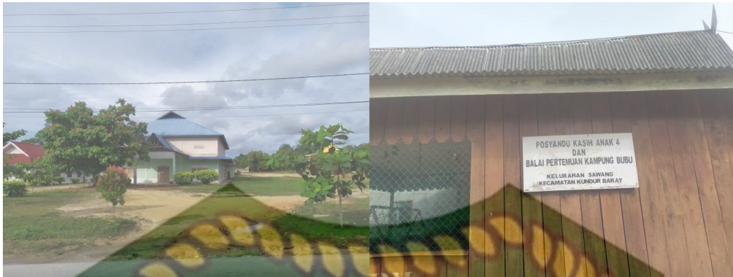
Gambar 5.11 Gedung Serbaguna dan Balai Pertemuan