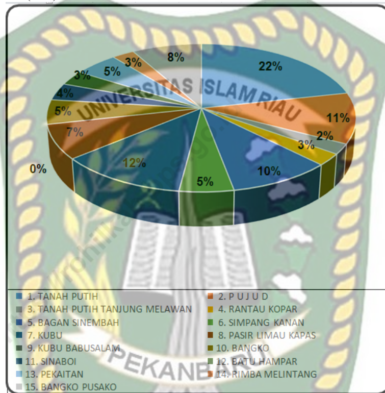
Gambar 4.1 Luas Wilayah Menurut Kecamatan di Kabupaten Rokan Hilir (km)