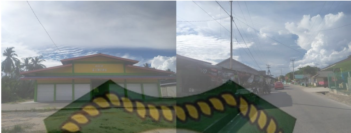
Gambar 5.9 Pasar Permanen dan Pasar Rakyat