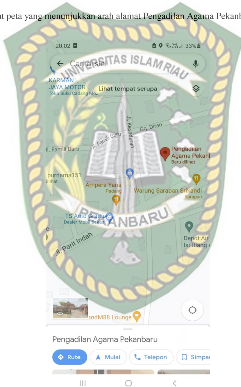
Gambar 2.3 Peta Alamat Pengadilan Agama Pekanbaru

Pengadilan Agama Pekanbaru beralamat di Jalan Datuk Setia Maharaja Jl. Parit Indah, Tengkerang Labuai, Kec. Bukit Raya, Kota Pekanbaru, Riau 28281. Berikut peta yang menunjukkan arah alamat Pengadilan Agama Pekanbaru: