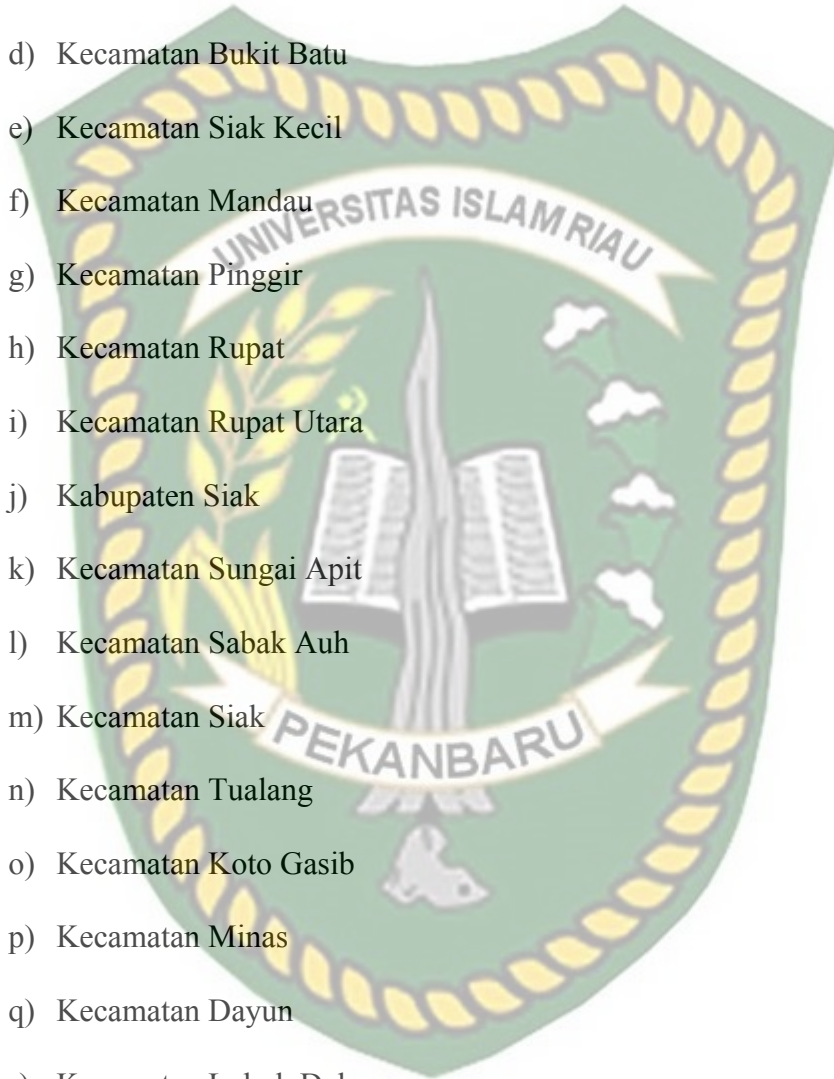
Tabel I. 1