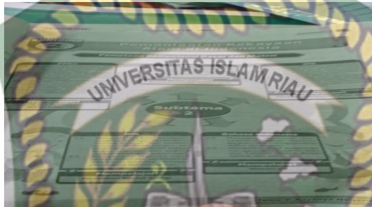
Gambar 4. LKS yang digunakan guru selama proses pembelajaran

pembelajaran sebanyak media berupa buku cetak dan LKS. Berdasarkan observasi, media yang digunakan guru selama proses pembelajaran adalah media pembelajaran yang sudah ada seperti buku cetak dan LKS. Buku yang digunakan peneliti saat melakukan observasi adalah observasi pertama yang digunakan guru pada Buku Topik 7 (indahny keberagaman negeriku), dan pada observasi kedua guru menggunakan Buku Topik 9 (indahny keberagaman negaraku). menggunakan Kayanyanegeriku). Berikut ini adalah contoh lembar kerja terdokumentasi yang digunakan oleh guru selama proses pembelajaran.