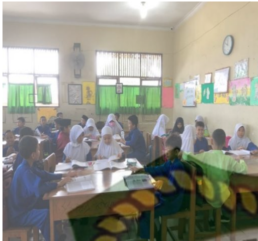
Gambar 2. Metode Diskusi Kelompok