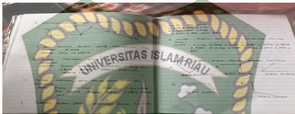
Gambar 1. Pemberian Tugas

Hal ini sesuai dengan pernyataan siswa di Kelas IVA dan IVB yang menunjukkan bahwa guru memberikan tugas kepada siswa selama proses pembelajaran. Dari hasil observasi dan penelitian dokumenter yang dilakukan peneliti, guru selalu memberikan tantangan kepada siswa selama proses pembelajaran. Tugas yang diberikan guru berkaitan dengan materi yang dipelajari siswa hari ini, atau KD yang dipelajari guru yang dicantumkan dalam buku dan LKS guru. Berikut ini adalah contoh dokumen tugas yang diberikan guru kepada siswa.