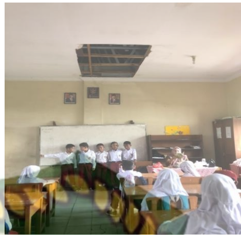
Gambar 6. Siswa Mengerjakan tugas diluar kelas Gambar 7. Siswa berdiri di depan kelas