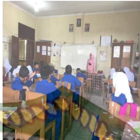
Gambar 3. Metode Ceramah

Pada Gambar 2, Anda dapat melihat bahwa guru menggunakan metode diskusi kelompok. Guru meminta siswa untuk bergabung dengan kelompok dan mendiskusikan apa yang telah mereka pelajari hari ini. Proses pembelajaran berbasis diskusi ini diharapkan dapat menumbuhkan semangat siswa untuk belajar bersama temannya. Metode diskusi kelompok juga melatih siswa dalam sikap dan tanggung jawab mendukung mereka untuk menetapkan tugas dan memotivasi mereka untuk belajar. Gambar 3 menunjukkan bahwa guru menggunakan metode ceramah, tetapi guru berdiri di depan kelas, dan ketika guru mengajar di depan kelas dan mengajarkan materi, semua siswa adalah guru. Dalam proses pembelajaran berbasis ceramah, guru dapat menjelaskan secara komprehensif, sehingga diharapkan siswa yang sulit dipahami dapat memahami dengan cara yang mudah dipahami. Pembelajaran yang disajikan tidak monoton, sehingga dengan menggabungkan beberapa metode dalam proses pembelajaran, siswa tidak akan bosan. Hal ini sejalan dengan pendapat (Nobisa 2021) bahwa berbagai metode pengajaran yang digunakan guru dalam proses belajar mengajarnya mendorong siswa untuk belajar. Dalam hal ini, setiap guru harus berusaha semaksimal mungkin untuk memilih metode pengajaran agar proses belajar mengajar menjadi efektif dan efisien. Oleh karena itu, guru hendaknya selalu mempertimbangkan untuk menggunakan metode pembelajaran yang berbeda agar siswa tidak bosan dengan proses pembelajaran dan selalu bersemangat dalam belajar.