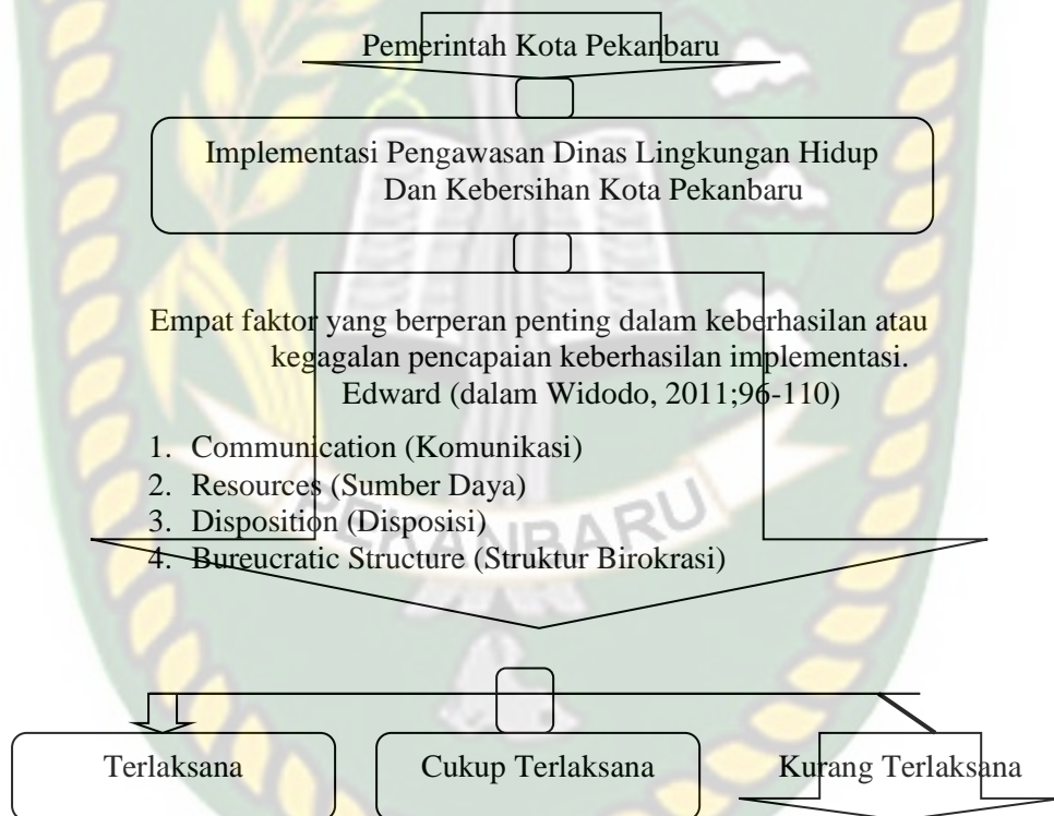
Gambar II.1 Kerangka Pemikiran Tentang Implementasi Fungsi Dinas Lingkungan Hidup Dan Kebersihan Kota Pekanbaru Terhadap Pengawasan Limbah Pabrik Karet.