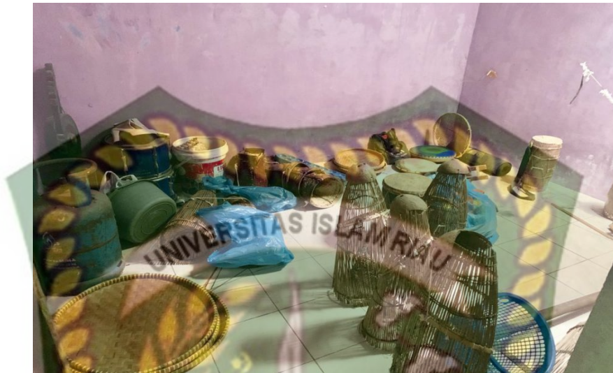
(Gambar 4. 6 Properti Sanggar Pinang Sinawa )