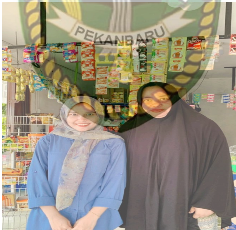
(Gambar 5.1 Wawancara Dengan Pimpinan Sanggar Pinang Sinawa )

e. Apakah ada sanksi bagi anggota yang melakukan kesalahan ketika lagi mengikuti proses latihan?