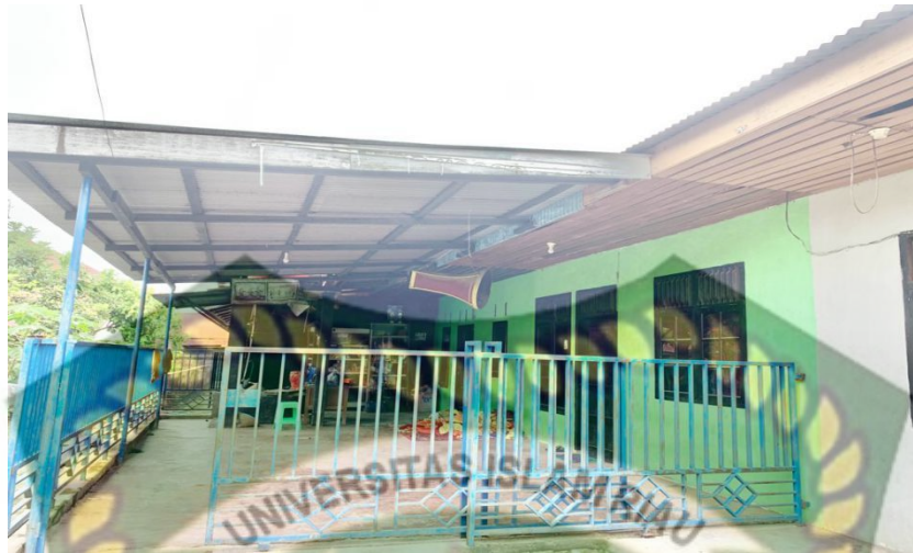
(Gambar 4. 2 Kondisi Fisik Sanggar Pinang Sinawa )