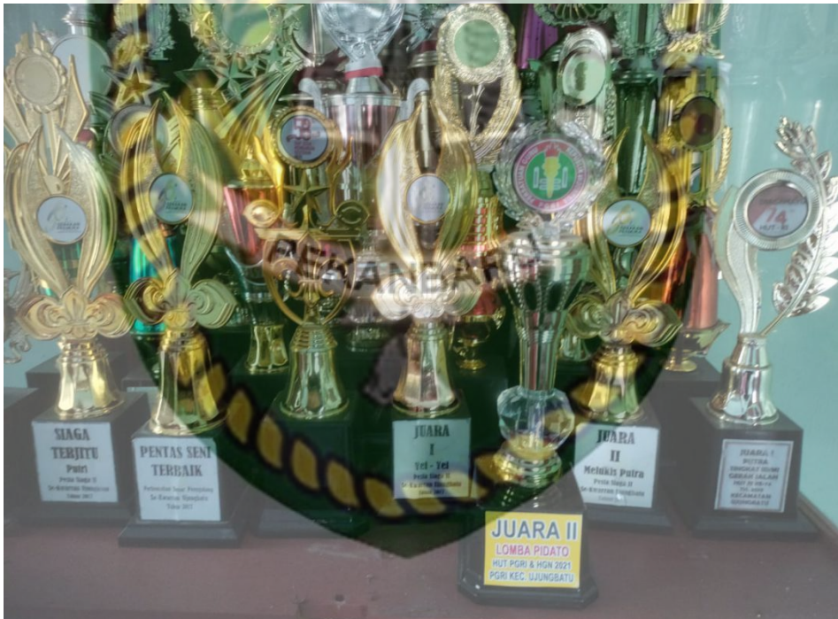
(Gambar 4. 9 Piala Prestasi Sanggar Pinang Sinawa )