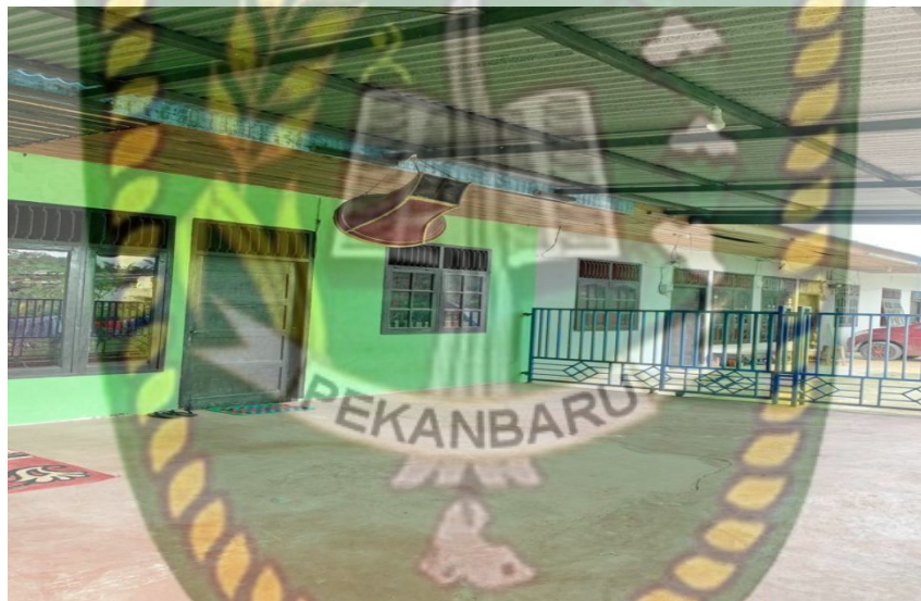
(Gambar 4. 3 Kondisi Fisik Tempat Latihan Sanggar Pinang Sinawa )