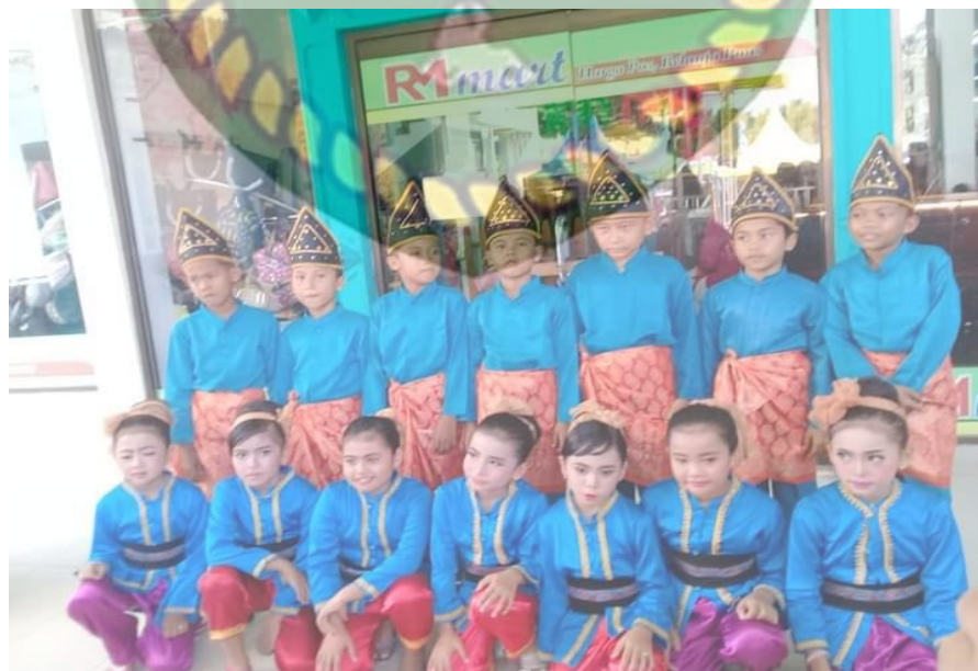
(Gambar 4. 7 Anggota Tari Dalam Pelaksanaan Mengisi Acara)

Berikut merupakan dokumentasi pelaksanaan kegiatan yang dilakukan sanggar pinang sinawa .