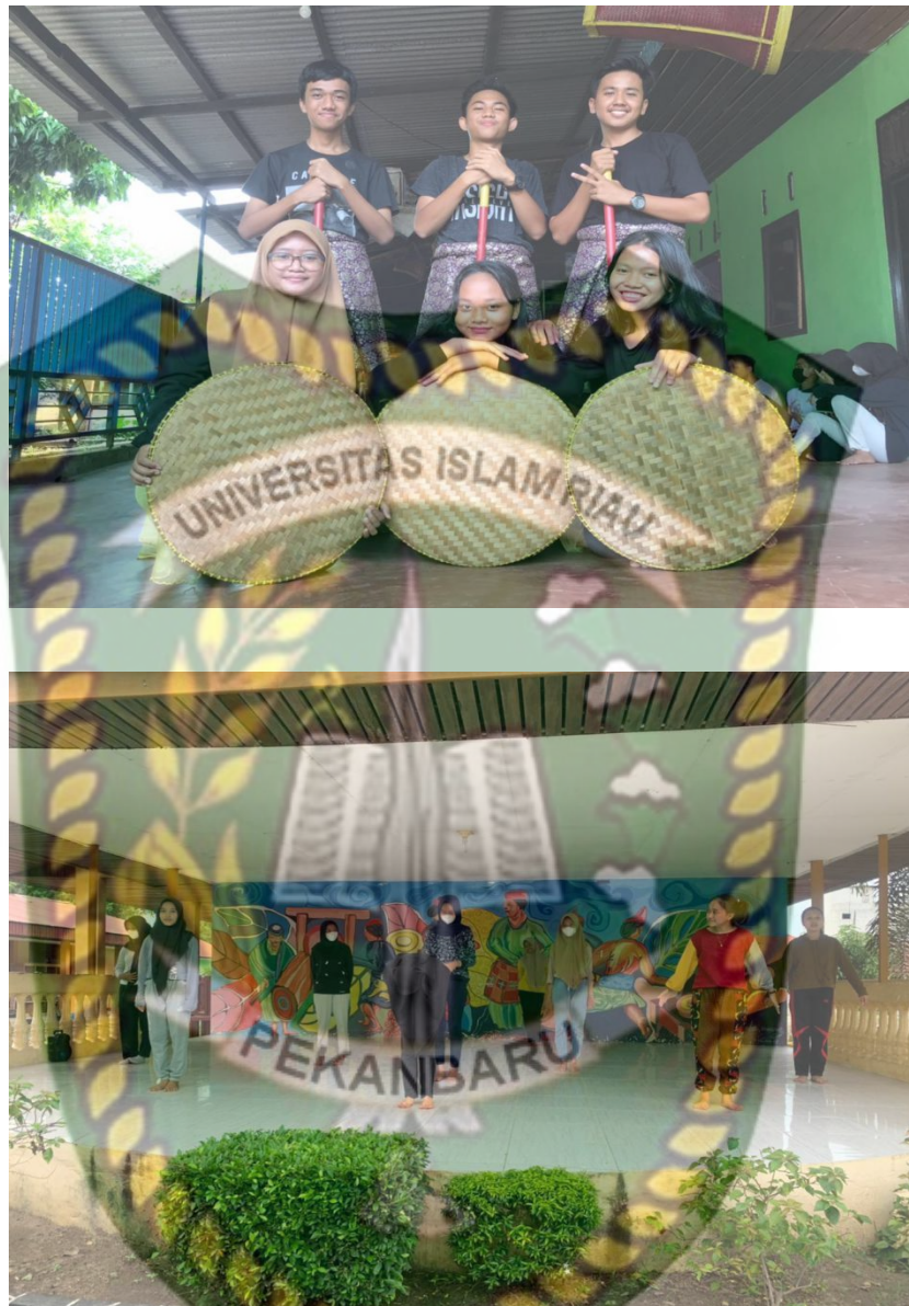
(Gambar 4.4 Kegiatan Latihan Disanggar Pinang Sinawa )