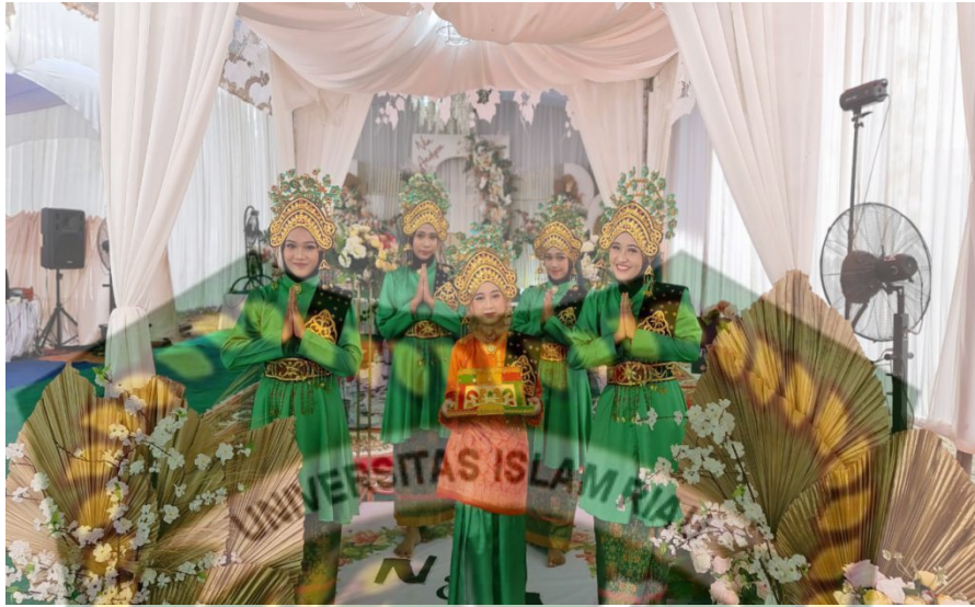
(Gambar 4. 8 Penampilan Tari Sanggar Pinang Sinawa Dalam Mengisi Acara)