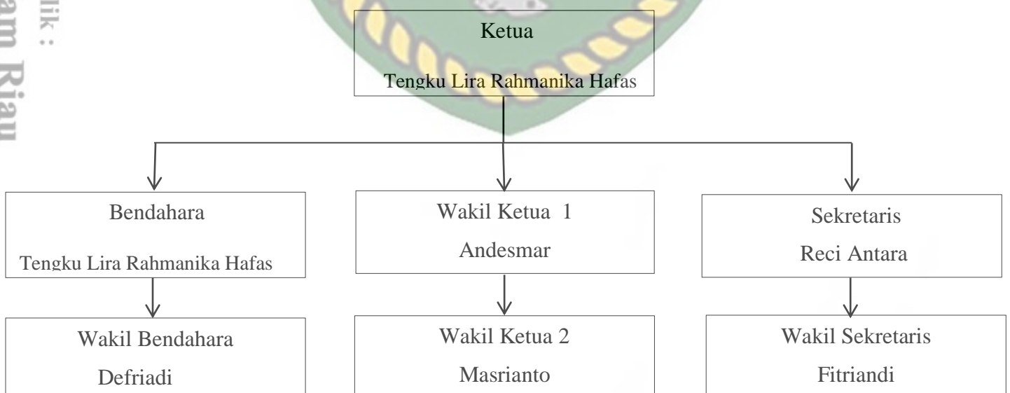
Tabel 4. 4 Susunan Pengurus Sanggar Pinang Sinawa