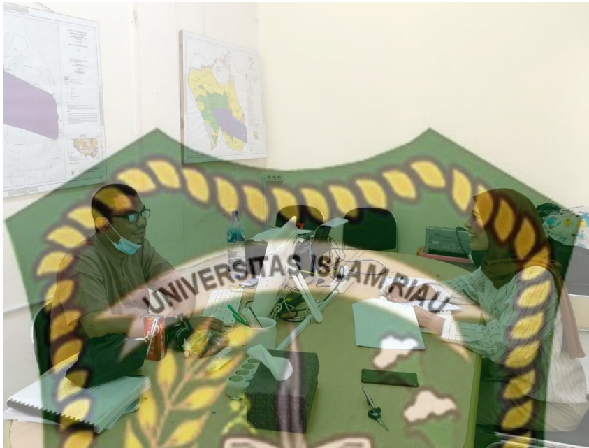
Wawancara dengan Direktur Eksekutif Yayasan Taman Nasional Tesso Nillo