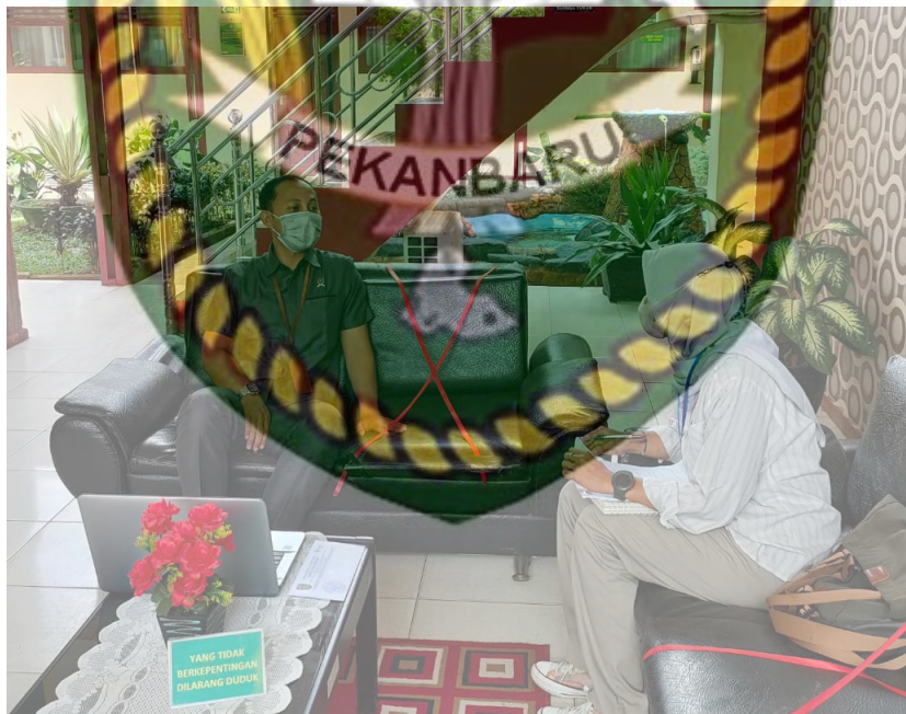
Wawancara dengan Juru Bicara Hakim Pada Putusan Nomor 303 / Pid.B /LH / 2020/ PN.Rgt