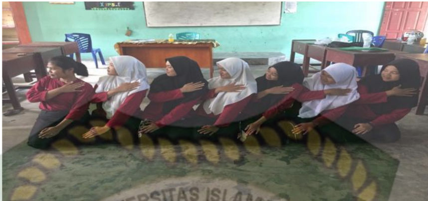
Gambar15. Gerakan ketiga pada bait pertama