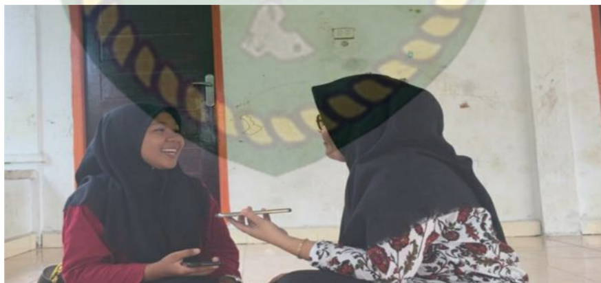
Gambar 2. Penulis melakukan wawancara dengan siswa ekstrakurikuler SMA Negeri 1 Kabun (Dokumentasi Sinta Marito 2020)

“tujuan utamanya menyalurkan minat bakat, menambah teman serta memanfaatkan waktu luang dengan hal-hal yang positif. Sebelumnya saya pribadi yang pemalu dan tubuh saya yang kaku setelah saya mengikuti ekstrakurikuler seni tari saya dapat menari dengan percaya diri dan tampil didepan umum juga mendapatkan kelenturan tubuh .selain itu saya juga mendapatkan banyak pengalaman untuk pengembangan bakat tari saya”.