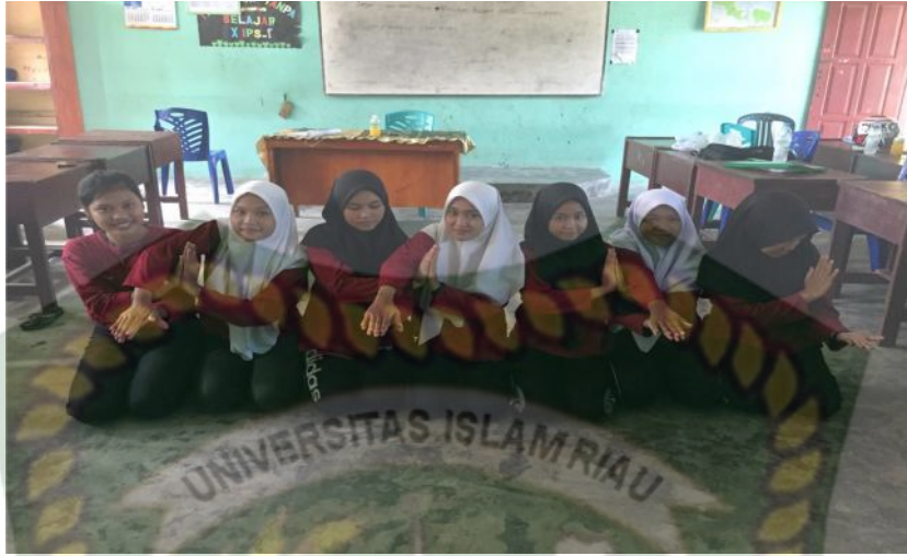
Gambar 12. Gerakan kedua pada bait pertama (Dokumentasi Sinta Marito, Januari 2020)