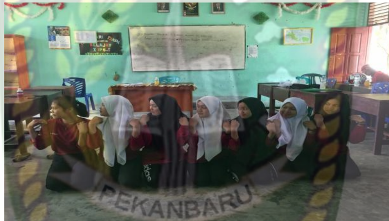
Gambar 6. Gerakan pertama pada bait kedua