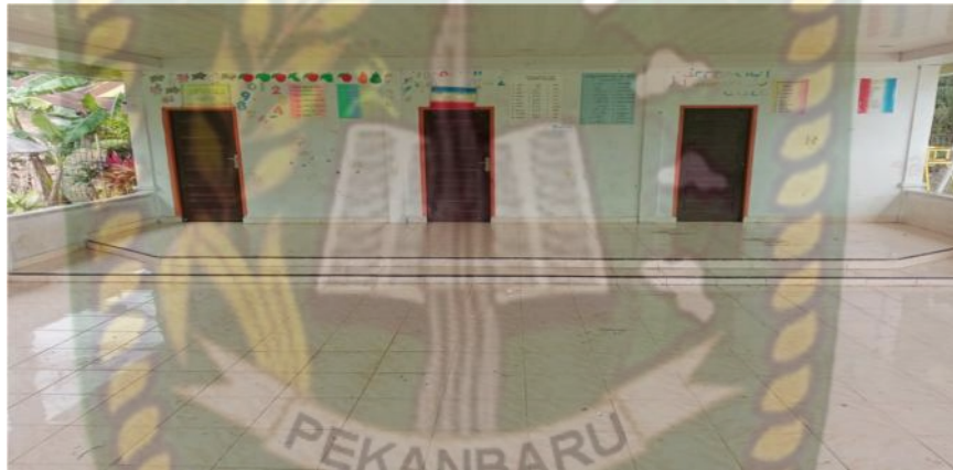
Gambar 26. Ruang Balai Adat (Dokumentasi Sinta Marito, Januari 2020)

Berdasarkan hasil wawancara yang penulis lakukan dengan Ibu Nurhamida Zulianti sebagai Pembina ekstrakurikuler seni tari SMA Negeri 1 Kabun pada tanggal 31 Januari 2020 yaitu: “ bagaimanakah sarana dan prasarana yang mendukung materi dalam kegiatan ekstrakurikuler dan bagaimanakah cara ibu memanfaatkan sarana dan prasarana dalam mendukung pelaksanaan ekstrakurikuler ini ?”