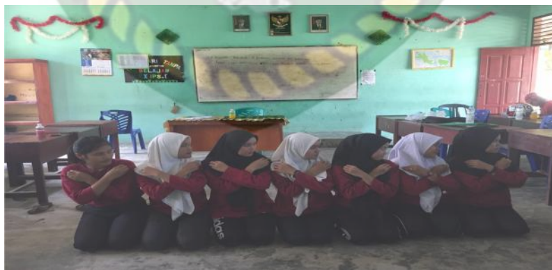
Gambar 7. Gerakan kedua pada bait kedua