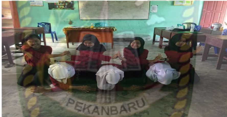
Gambar 21. Gerakan ketiga

siswa pertama dan siswa ketiga berpegangan tangan dengan posisi tangan meyilang dan membentuk ombak dari depan.