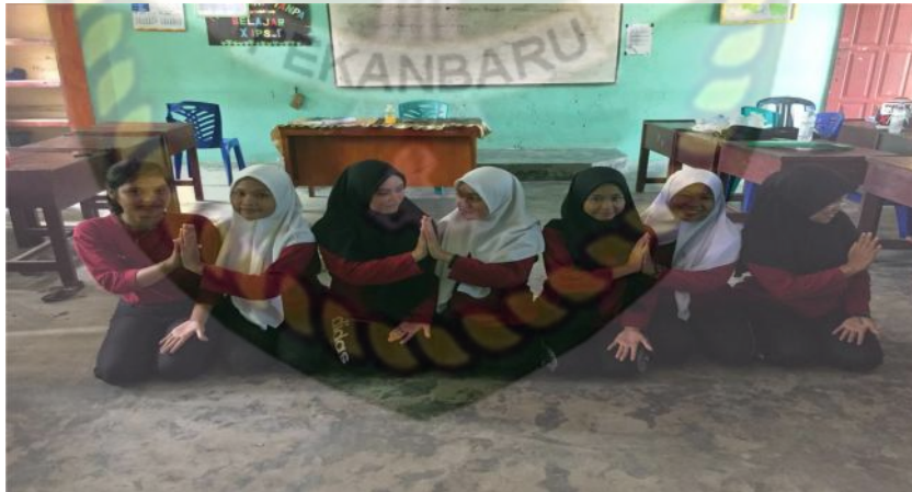
Gambar 11. Gerakan pertama pada bait pertama

Sheikh: Lem burak menari lam ateuh Runggunong lahombak, cabeung bungong hain aneuk Leun kuak.. 3x