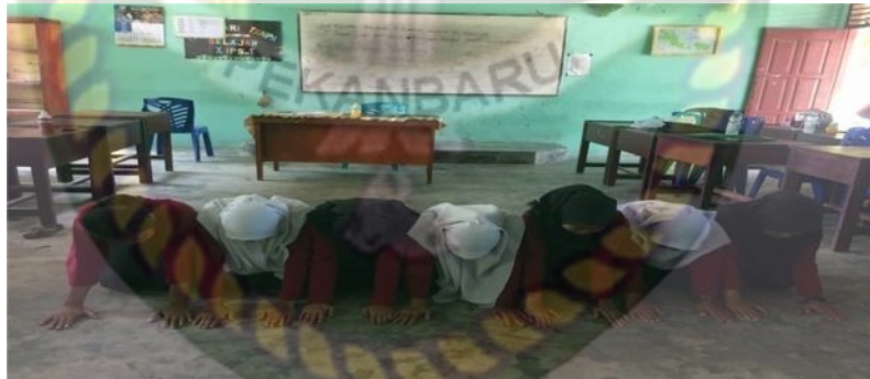
Gambar 4. Gerakan kedua pada bait pertama