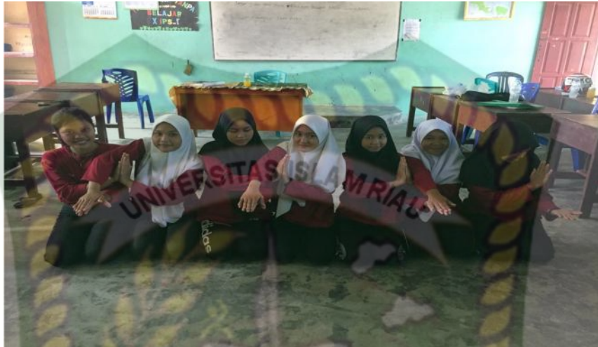
Gambar 13. Gerakan pertama pada bait pertama