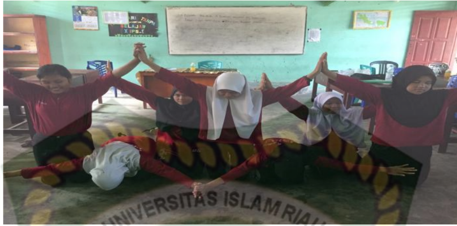
Gambar19. Gerakan pertama (Dokumentasi Sinta Marito, Januari 2020)