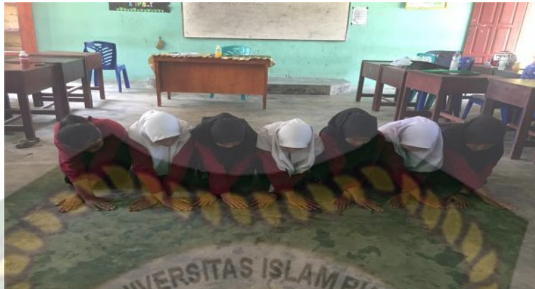
Gambar 5. Gerakan ketiga pada bait pertama (Dokumentasi Sinta Marito, Januari 2020)