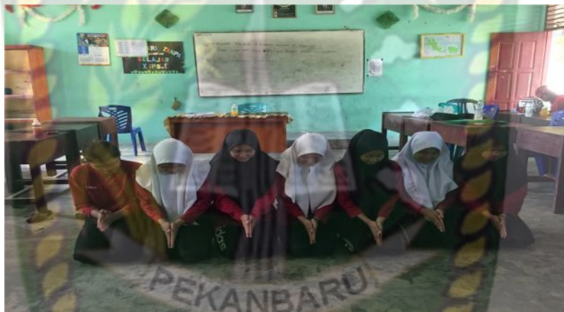
Gambar 9. Gerakan keempat pada bait kedua (Dokumentasi Sinta Marito, Januari 2020)