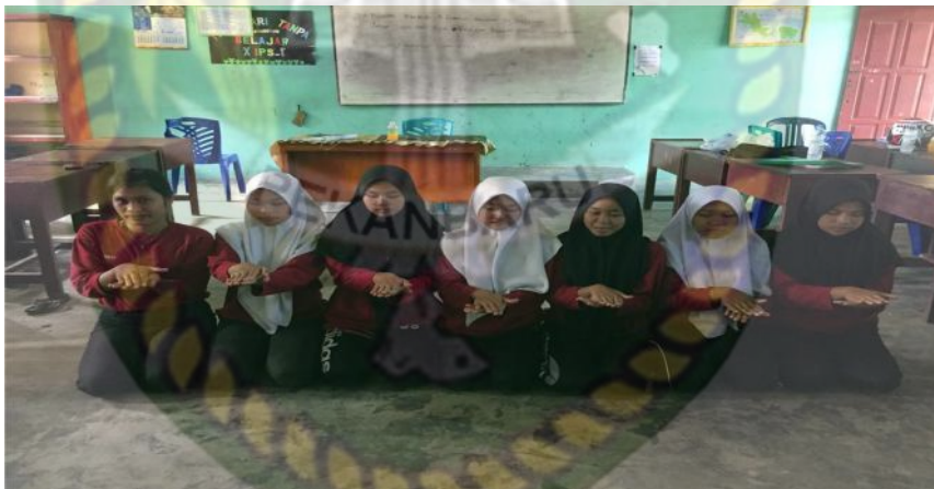
Gambar 14. Gerakan kedua pada bait pertama