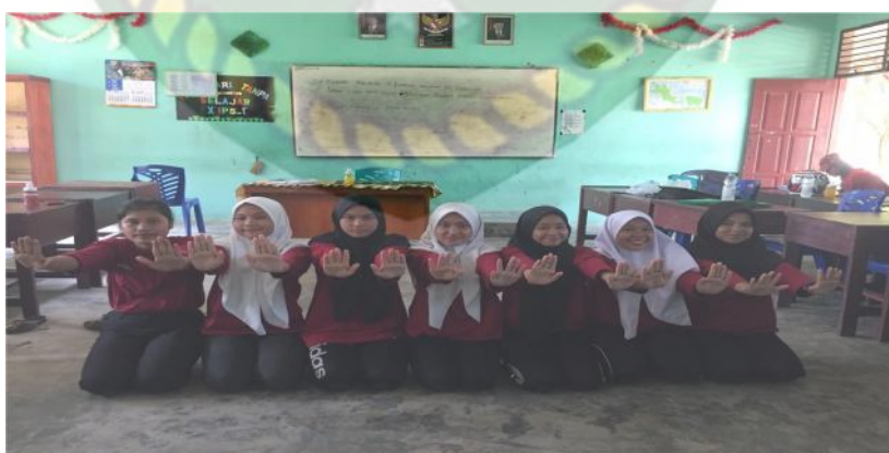
Gambar 10. Gerakan kelima pada bait kedua