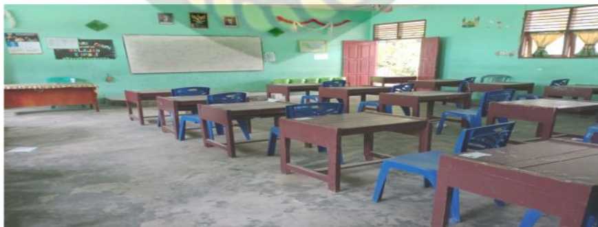
Gambar 24. Ruang Kelas

Berdasarkan observasi penulis dilapangan pada tanggal 31 Januari 2020 pelaksanaan kegiatan ekstrakurikuler pada tari saman di SMA Negeri 1 Kabun untuk materi saman memang tidak membutuhkan media sarana seperti speaker, tape ataupun recorder. Karena tari saman menggunakan lagu yang dinyanyikan sendiri oleh penarinya. Namun untuk sarana dan prasarana ruangan sangat kurang memadai hal ini dikarenakan tidak terdapat ruangan khusus untuk kegiatan ekstrakurikuler seni tari, sehingga dalam proses latihan ini menggunakan ruangan kelas dan untuk penampilan seperti kostum , makeup dan sebagainya dalam tarian ini siswa menggunakan baju khusus ekstrakurikuler dan untuk makeup sekolah memilikinya.