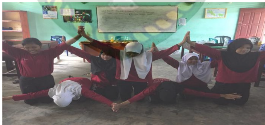
Gambar 20. Gerakan kedua (Dokumentasi Sinta Marito, Januari 2020)

hanya dilantunkan oleh syeikh saja dan gerakannya dilakukan dengan arah sebaliknya.