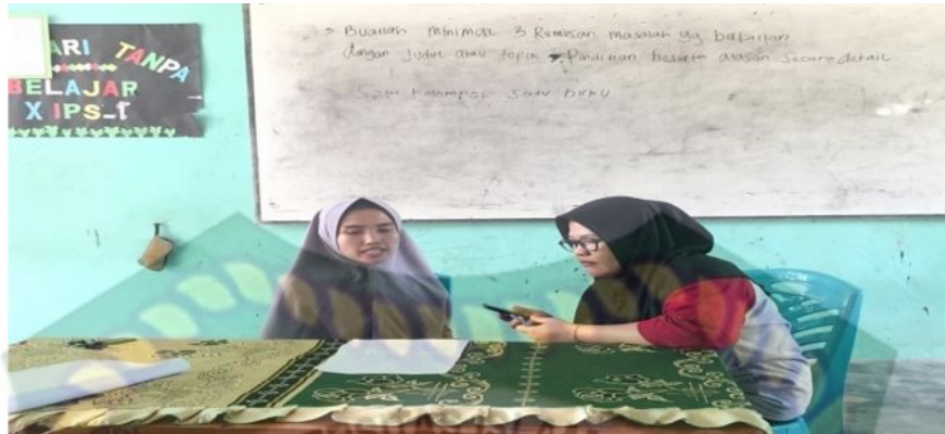
Gambar 1. Penulis melakukan wawancara dengan Pembina ekstrakurikuler SMA Negeri 1 Kabun

Selain hasil wawancara dengan guru ekstrakurikuler, penulis juga mewawancarai siswi yakni Nadia Imelda pada tanggal 31 Januari 2020 terkait tentang “ apakah tujuan dari kegiatan ekstrakurikuler seni tari di SMA Negeri 1 Kabun ?”