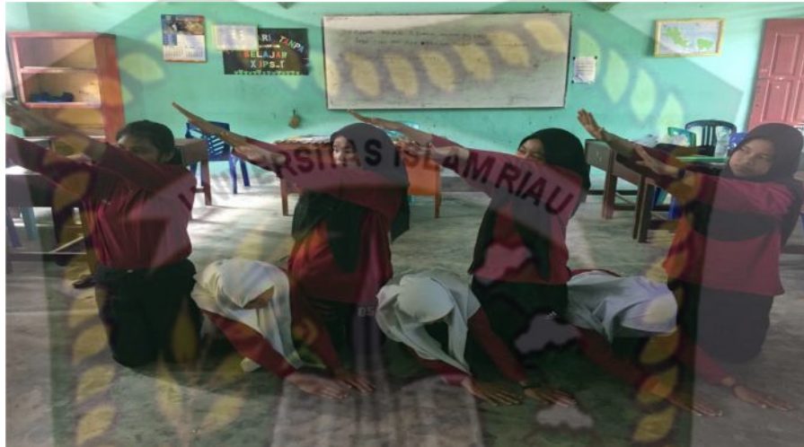
Gambar 23. Gerakan kelima

selanjutnya kedua tangan lurus menyentuh lantai dengan arah serong kanan bawah lalu serong kiri bawah dan serong kanan atas lalu serong kiri atas dilakukan sampai lirik selesai