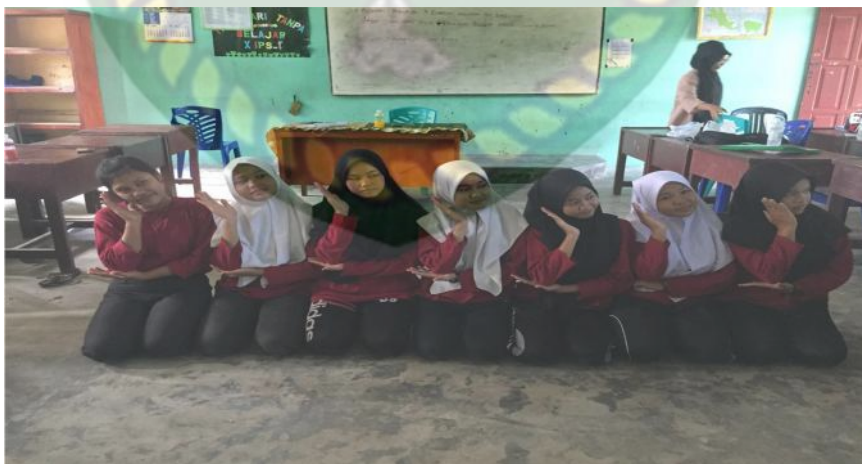
Gambar 17. Gerakan kelima pada bait pertama (Dokumentasi Sinta Marito, Januari 2020)