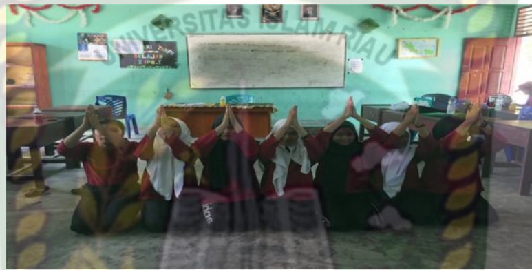
Gambar 3. Gerakan pertama pada bait pertama