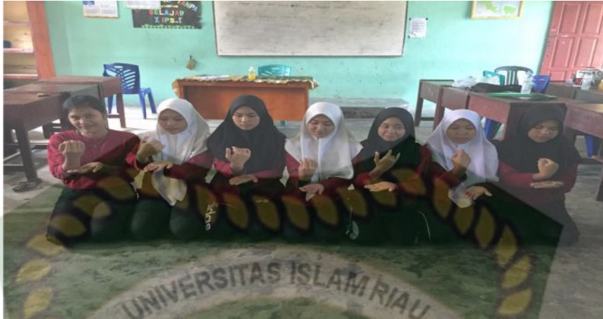
Gambar 18. Gerakan pertama pada bait kedua (Dokumentasi Sinta Marito, Januari 2020)