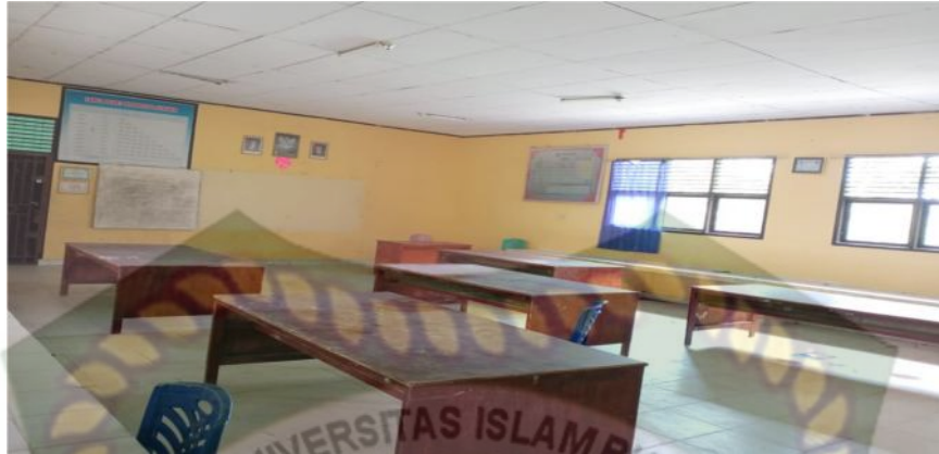
Gambar 25. Ruang Laboratorium (Dokumentasi Sinta Marito, Januari 2020)