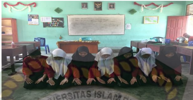
Gambar 8. Gerakan ketiga pada bait kedua (Dokumentasi Sinta Marito, Januari 2020)