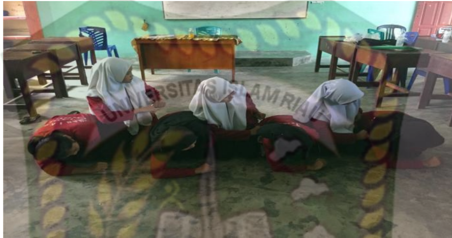
Gambar 22. Gerakan keempat (Dokumentasi Sinta Marito, Januari 2020)

yang hanya dilantunkan oleh syeikh saja dengan gerakan sikut tangan bergantian menyentuh lantai selanjutnya sikut tangan menyentuh paha secara bergantian lalu gerakan.