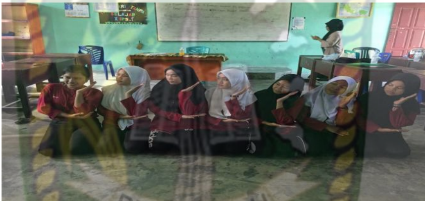
Gambar 16. Gerakan keempat pada bait pertama (Dokumentasi Sinta Marito, Januari 2020)