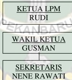
Gambar IV.2 : Struktur Lembaga Pemberdayaan Masyarakat Desa Di Desa Kampung Baru

Struktur Lembaga Pemberdayaan Masyarakat Desa Di Desa Kampung Baru dapat dilihat di gambar berikut :