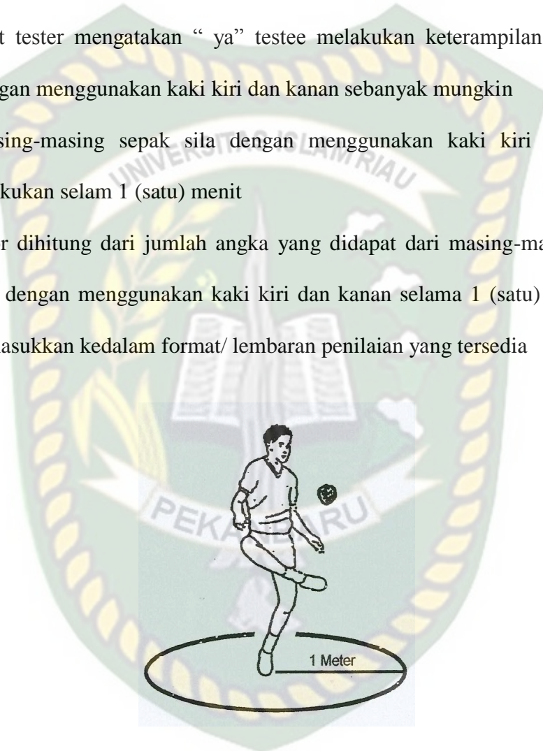
Gambar 4 : Melakukan Sepak Sila Kontrol Bola