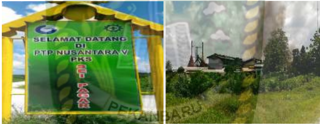
Gambar 3.1 Lokasi Penelitian PT. Perkebunan Nusantara V

Tempat pelaksanaan pengambilan data untuk penelitian tugas akhir tentang pengaruh variasi tekanan uap outlet superheater terhadap performance steam turbine di PT. Perkebunan Nusantara V Sei Pagar ini dilaksanakan pada tanggal 05 Juli 2017 selama \pm 7 hari (1 minggu) pada pukul 07.00 sampai 17.00 WIB di PT . Perkebunan Nusantara Sei Pagar Kampar Riau. Gambar lokasi penelitian dapat dilihat pada ( gambar 3.1 ) dibawah ini :