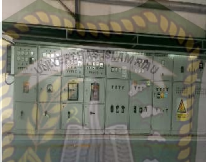
Gambar 3.4 Main Panel Turbin uap (PT. Perkebunan Nusantara V Pks Sei Pagar)

Adalah suatu sistem equipment yang terdiri dari pemutus, metering , protection , control , dan monitoring menjadi satu kesatuan bagian yang saling berhubungan.