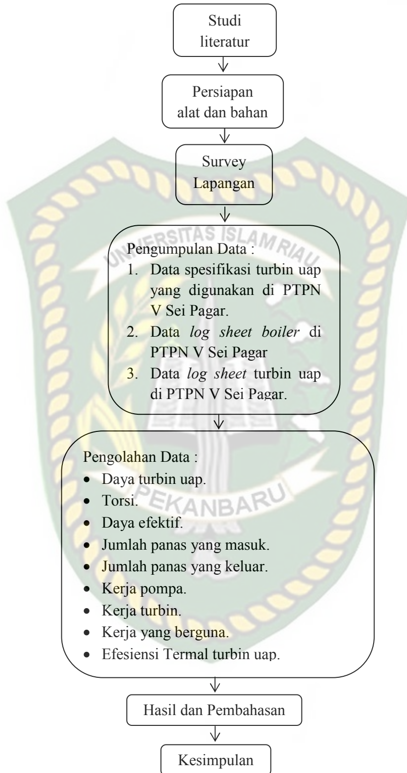
Gambar 3.7 Diagram Alir Penelitian