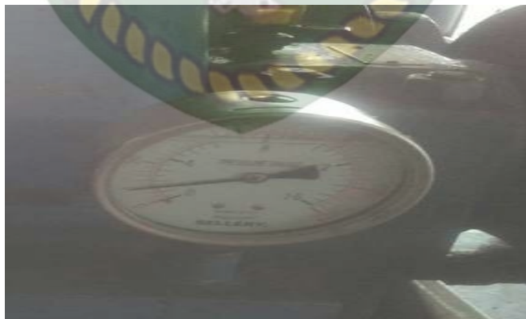
Gambar 3.5 Pressure Gauge (PT. Perkebunan Nusantara V Pks Sei Pagar)

Pressure gauge adalah suatu alat untuk indicator untuk mengukur tekanan kerja pada turbin uap.