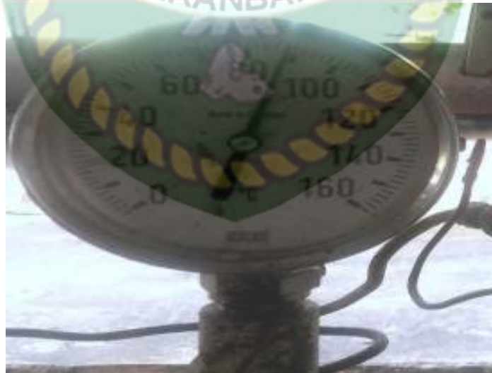
Gambar 3.3 Thermometer (PT. Perkebunan Nusantara V Pks Sei Pagar)

Adalah suatu alat untuk mengukur temperature uap dari boiler, peralatan ini juga di pasang untuk memonitor temperature gas buang boiler pada cerobong asap, dengan temperatur 260°C dan gas buang boiler dengan temperatur 300°C.