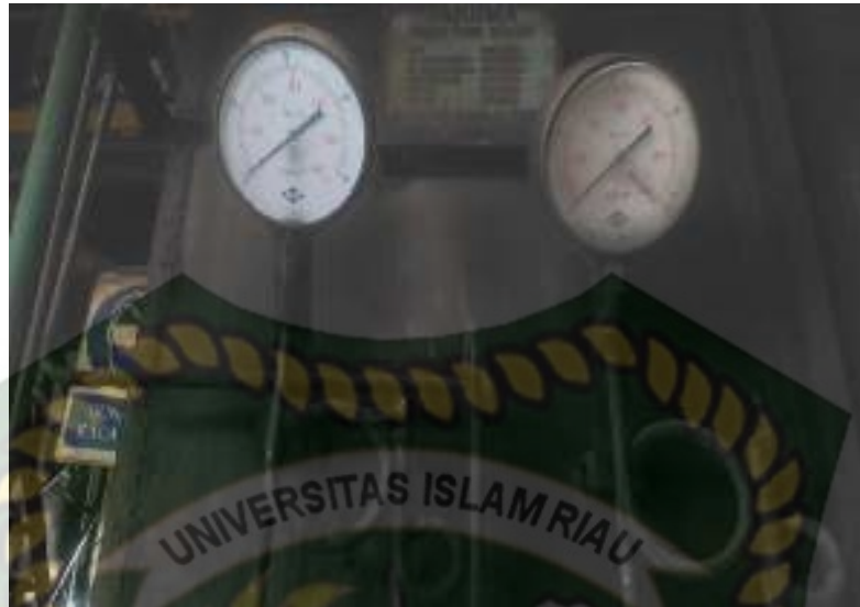
Gambar 3.2 Manometer (PT. Perkebunan Nusantara V Pks Sei Pagar)