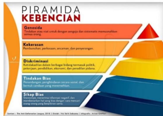
Gambar 1. Pyramid of Hate

9 informasi negatif serta membenarkan hal bias dengan cara mencari orang-orang yang berpikiran sama; b. Tindakan bias: perundungan, penghindaran secara sosial dan bentuk candaan yang mengarah kepada meremehkan; c. Diskriminasi: ketidakadilan dalam berbagai bidang termasuk politik, pekerjaan, pendidikan, ekonomi dan pidana; d. Kekerasan: pembunuhan, perkosaan, ancaman dan penyerangan; e. Genosida: tindakan atau niat untuk dengan sengaja dan sistematis memusnahkan semua orang. (dalam Kurniawan dkk, 2021).